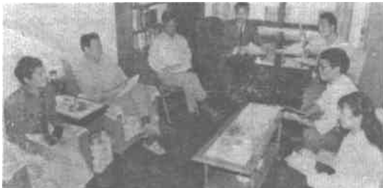
图为市科委的领导与同志们一起研究工作。