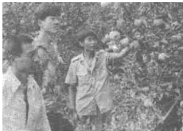
发展林果生产是陈庄镇“两高”农业规划的主要项目之一。目前全乡已种植菜园5500亩，逐步占领当地市场。

今年以来，陈庄木器厂更加注重产品质量，增强市场竞争力，努力实现产值100万元、利税20万元的奋斗目标。