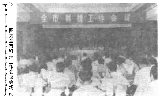
图为全市科技工作会议会场

级星火计划项目20个，并支持了2个省级火炬计划项目的实施，有力地推动了我市地方工业企业的发展。他们配合科技部门发展了大王镇、辛店镇、胜坨乡三个星火技术密集区，目前，区内企业大都已初具规模，形成了以东营市造纸厂、东营市水泥制品厂、东营市石棉器材厂等为代表的一批骨干型科技企业。他们发放固定资产贷款200万元，流动资金贷款500万元，支持东营市造纸厂实施的“HSC—高级超级压光纸系列产品开发”项目，填补了国内空白，其产品远销十几个国家和地区。