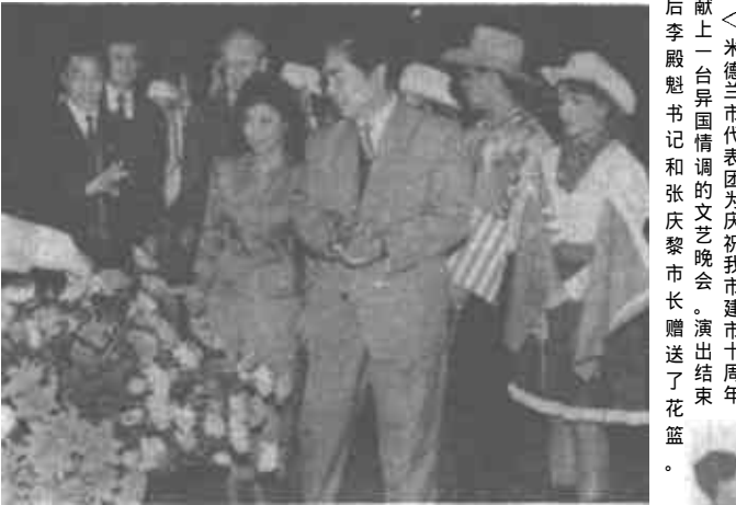
美国米德兰市女代表团在我市访问摄影