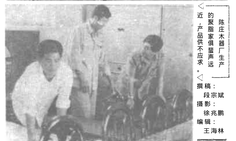
陈庄木器厂生产的聚脂家具俱备声远，产品供不应求。